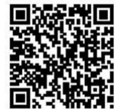
ホームページへのQRコード

7月14日(火)は志津川中学校区の小・中学校4校による一斉「引き渡し訓練」が行われます。年に1回の「引き渡し訓練」となりますので、この機会に御家庭でも「引き渡し開始メール」が届いてからの家族での連絡手段を確認してみてもいいでしょうか。御家庭の事情により、下図のA~Cまでのパターンの他にも連絡方法があると思いますが、年1回の機会を利用して連絡手順を確認し「家庭での訓練」をお勧めします。いざという時に、誰が誰に連絡を入れ、誰が子供を迎えに行くかを家族で話し合ってみてはいかがでしょうか。子供たちは地震発生時の避難訓練を、職員は津波警報解除後に引渡しのための訓練を行います。引渡し準備が完了しだい「引き渡し開始メール」が配信されますので15:30は目安の時間となりますことを御了承願います。子供たちには御家庭で「連絡訓練」を行うため15:30以後に『お迎え』が来ることを話しておきます。17:00まで訓練は行っておりますので、ぜひ、『お迎え』だけを目的にせず、この機会を利用してください。下記は訓練の流れです。