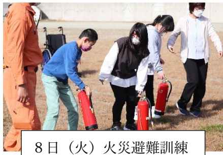
8日(火) 火災避難訓練