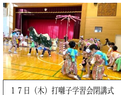
17日(木) 打囃子学習会閉講式