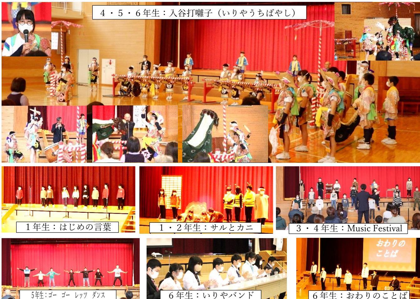
4・5・6年生：入谷打囃子（いりやうちばやし）