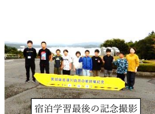
宿泊学習最後の記念撮影

10月4・5日に、1泊2日で宿泊学習に行ってきました。友達との絆を深めて、充実した2日間を過ごすことができました。