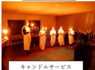
キャンドルサービス