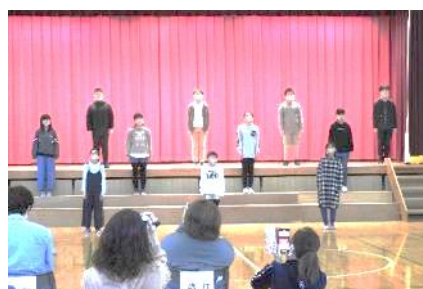
6年生 おわりの言葉