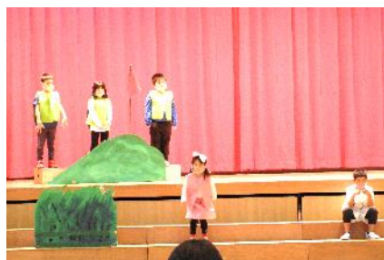
1年生 うさぎとかめ