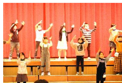
3～4年生 Get Through