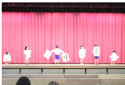
1年生 はじめの言葉