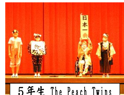
5年生 The Peach Twins