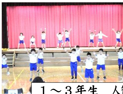
1～3年生 人気アニメでレッツダンス!