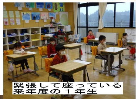
緊張して座っている 来年度の1年生

来年度入学予定の6名の1日入学がありました。新入学児童の保護者の皆さんへの学校説明会が終わるまで、絵を描いたり紙芝居を見たりしながら楽しく活動して帰りました。