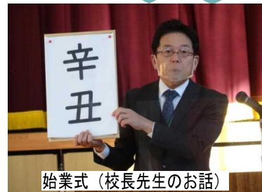
始業式（校長先生のお話）

始業式で校長先生からは、「今年の干支は60年に一度の『辛丑（かのとうし）』と言い、「何かが変わる年、新しいことが始まる年」とされていて、皆さんが「できなかったことができるようになる年」「できることがたくさん増える年」「苦手なことが得意になる年」になる可能性が大きい年です。」というお話しがありました。この話のように子供たちが着実に力を付け、躍進する年となるよう、「職員全員が全児童の担任である」という意識に立ち、支援してまいります。昨年同様、皆様の御協力をよろしくお願いいたします。