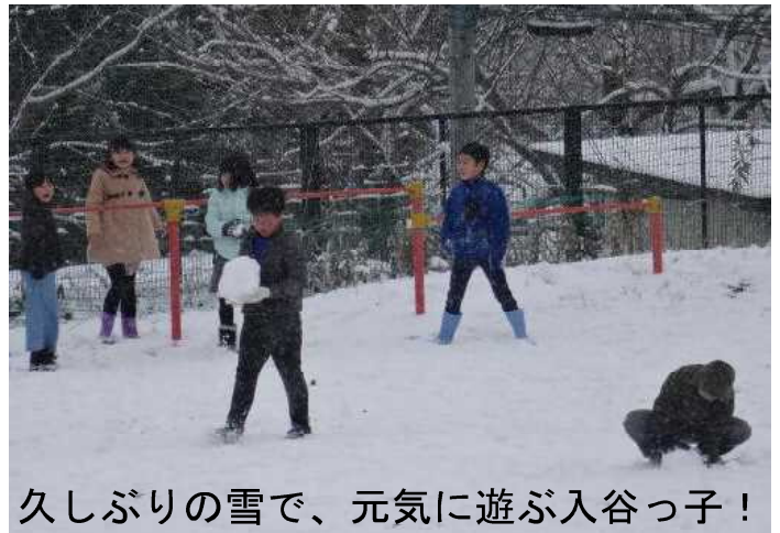
久しぶりの雪で、元気に遊ぶ入谷っ子！

終わりになりますが、保護者の皆様や地域の皆様から頂戴した学校への御理解と御協力に感謝申し上げます。本当にありがとうございました。新年もどうぞよろしく願いいたします。