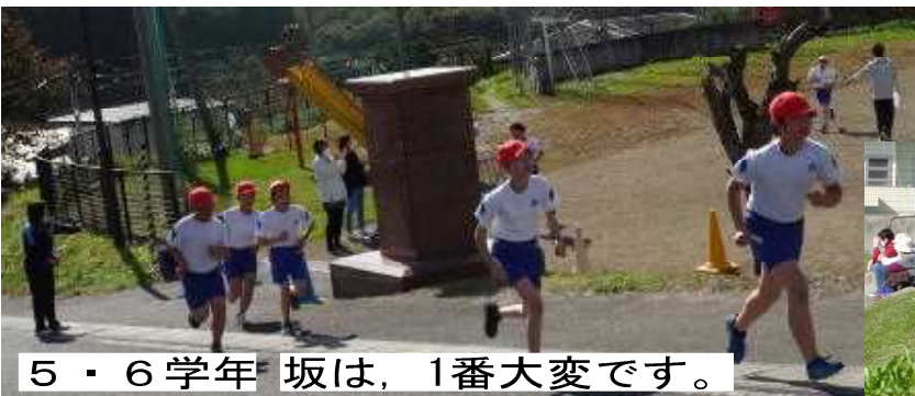
5・6学年 坂は、1番大変です。