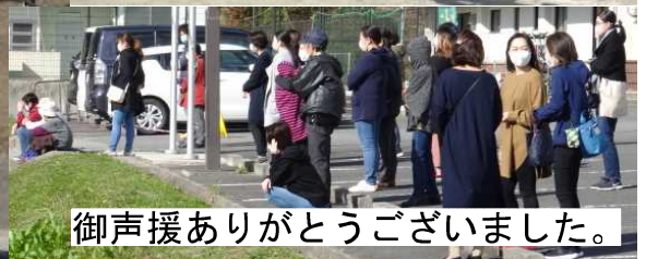
御声援ありがとうございました。