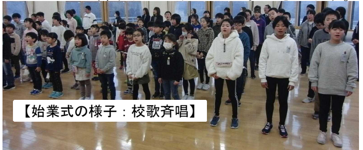
【始業式の様子：校歌斉唱】