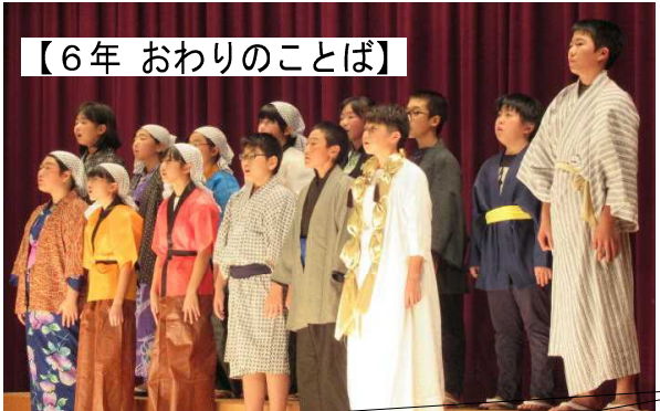
【6年 おわりのことば】