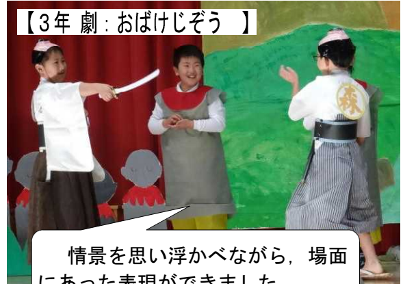
【3年 劇：おばけじぞう】