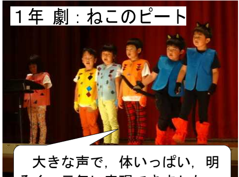
1年 劇：ねこのピート

お客さんに、5年生全員が明日へ向かって元気に歩んでいることを、ダンスを取り入れながら演じることができました。