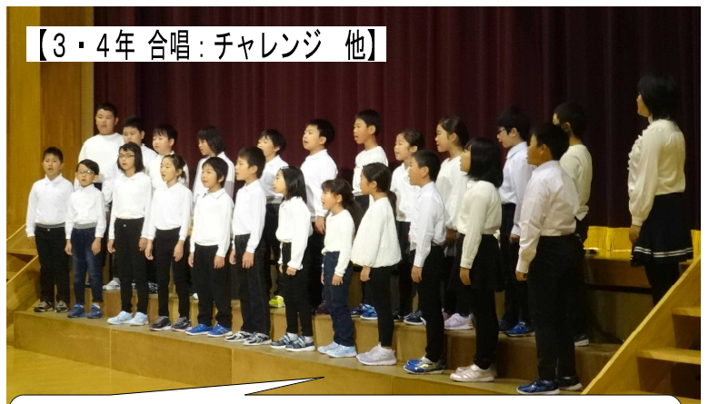
【3・4年 合唱：チャレンジ 他】

指揮者をしっかり見て, 伴奏をしっかり聴いて, 心一つにして, 歌うことができました。