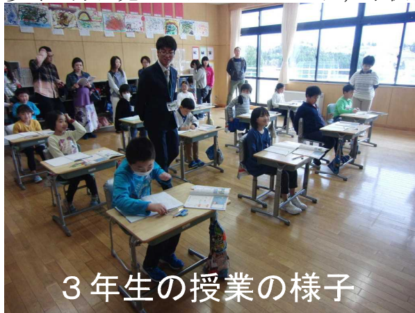
3年生の授業の様子

新学期が始まって最初の授業参観であり、どの学年・学級も新鮮な雰囲気の中で、子供たちの希望と意欲に満ちた学習の様子をたっぷりご覧いただけたと思います。自分の学習の様子を多くの方に見ていただいたことは、子供たちにとってよい励みとなります。参加日に見せたよ