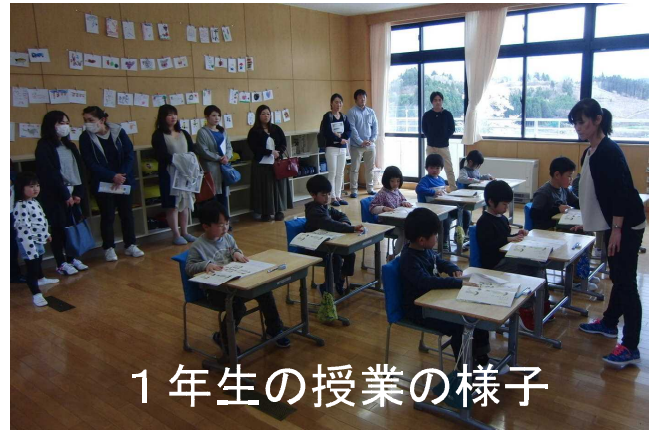
1年生の授業の様子

4月15日（日）に本年度最初の学習参観日とPTA総会、そして学年懇談会が行われました。日曜参観ということもあり、当日は大勢の保護者の皆様に授業参観にお出でいただきました。