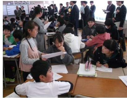
自分の考えを伝え合う