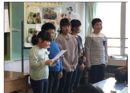
食材の魅力を伝える発表