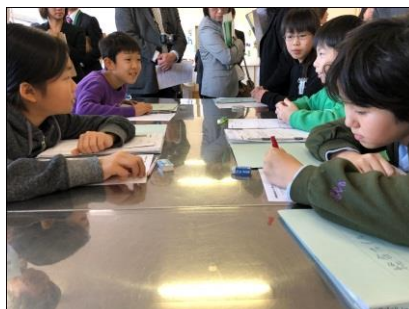
グループで献立作り