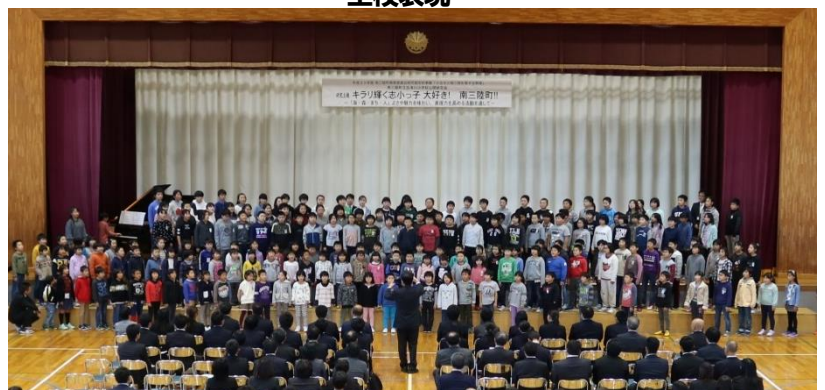
校長先生の指揮で「ふるさと」を歌いました