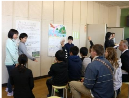
グループごとに発表

聞き手の児童も相手グループの発表を真剣に聞き、質問をするなど、積極的に取り組むことができました。