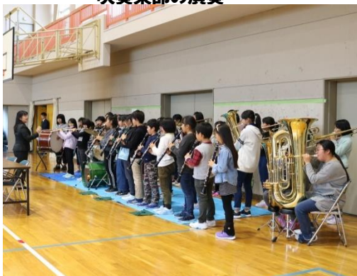
全校表現の入場の音楽を演奏