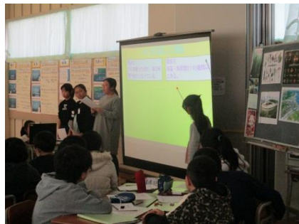
プレゼンテーション形式の発表

地域の方から学んだ町の現状や課題から発想を広げ、より良いまちづくりについて考えることができました。グループ内でまとめた内容だけでなく、発表を聞いた児童から出された考えも伝え合うことで、まちづくりへの考えを深めることができました。