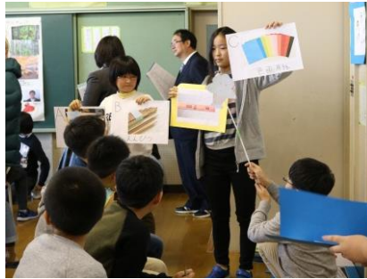
図や写真を使った説明