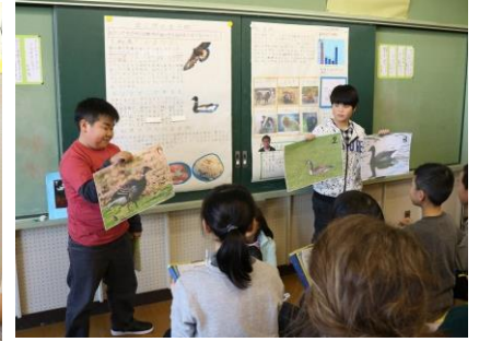
南三陸町に関するクイズ