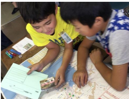
避難場所を考える活動