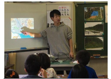
プロジェクターの活用