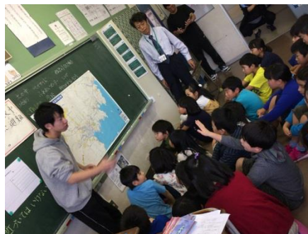
ハザードマップの活用