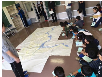
安全マップの作成