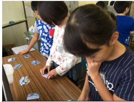
自分の地区の危険な場所の写真を選ぶ