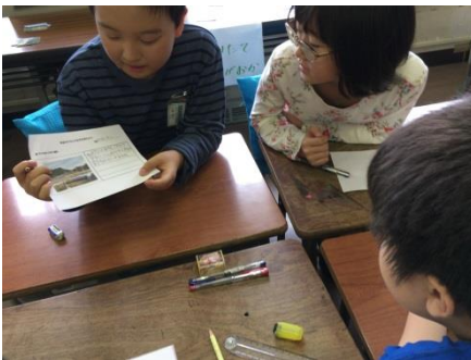
グループごとに危険な場所の共有