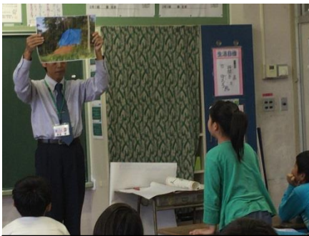
写真による危険な場所の把握