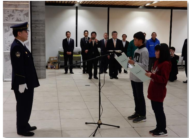
南三陸警察署長さんの前で、大きな声ではっきりと出動宣言を行うことができました。

これから年末・年始にかけて各種犯罪や交通事故の被害から地域住民を守るため、決意を新たに、「みんなでつくろう安心の街」を合い言葉に、ただ今から「年末・年始特別警戒」に出発いたします。