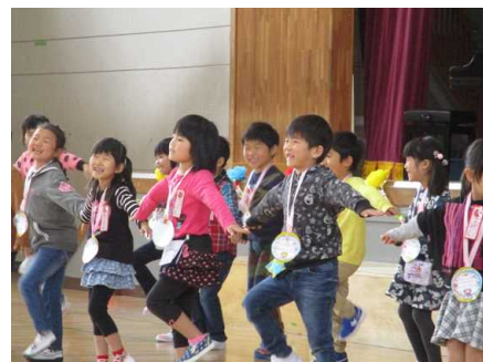
【上級生と一緒に踊る1年生】