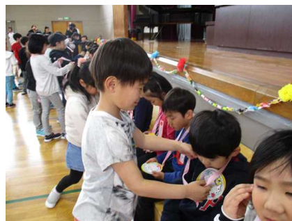
【メダルをプレゼントする2年生】