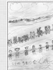
川は、いのちをつなぐ場所