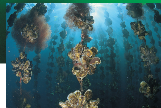
※海中写真4点は、佐藤長明さんが 志津川町椿島周辺で撮影したものです。