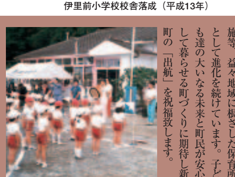
伊里前小学校校舎落成 (平成13年)