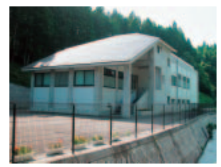
歌津浄化センター完成 (平成14年)