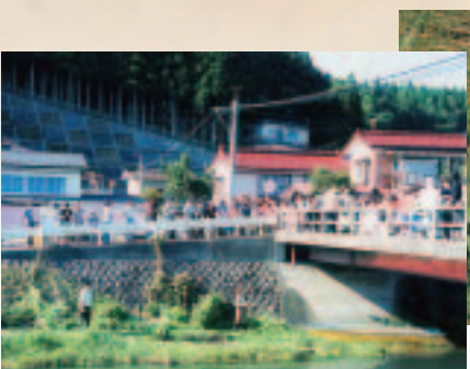
アワビ稚貝の標識放流開始 (平成16年)