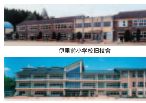
伊里前小学校旧校舎