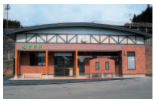
JR歌津駅乗車券発売所完成 (平成17年)