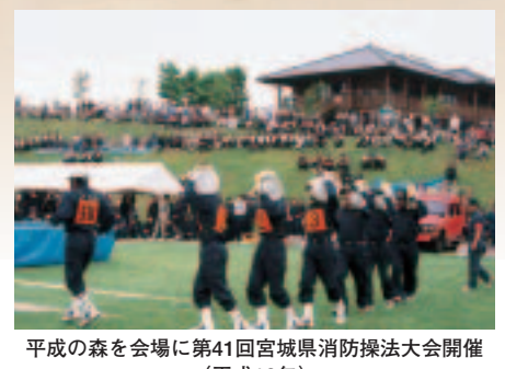
平成の森を会場に第41回宮城県消防操法大会開催 (平成12年)