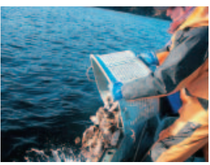
アワビ稚貝の標識放流開始 (平成16年)