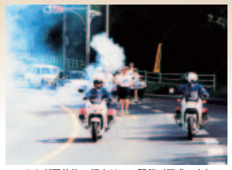
みやぎ国体旗・炬火リレー開催 (平成13年)