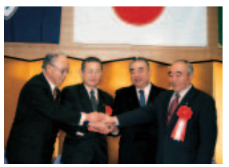
本吉町との行政界確定協定締結調印 (平成13年)