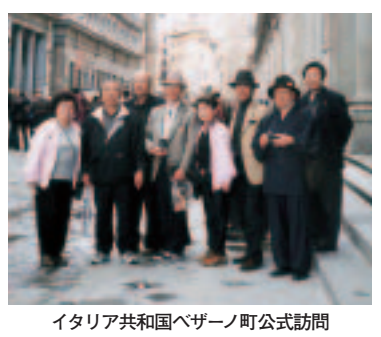
イタリア共和国ベザーノ町公式訪問 (平成13年)

平成の大合併により いよいよ平成の大合併により、「南三陸町」が誕生することになり、「歌津町」という町の名がなくなり、歌津町の象徴の一つともいえる田表(中在)で育った私としては、「うたつ」という町がなくなることに一抹の寂しさを感じますが、住所表示に「歌津」が残っていると聞いて、ましてやあの海や山が突然消えてしまうわけでもなく、まずは「南三陸町」という船が、希望に彩られ悠然と出航されることを心からお祝いしたいと思います。 私事ですが、仙台に住むようになって早くも11年目となりました。多くの歌津町出身者が自分の中にふるさと歌津のイメージというものを持っていると思います。私の場合は食べ物もそのひとつでしょうか？ ふるさと自慢ではありませんが、宮城県は全国でも美味しいものが数多く揃った県であり、さらにその中でも歌津・志津川はど様で豊かな食材に恵まれた地域もないでは、などと、常々思うことがあります。これと四季折々に魅せる自然の風景はまさに歌津の大切な財産でしょう。どうぞ、「南三陸」という名称にふさわしい、これまでも以上に情緒と自然が豊かで人間味溢れる町であらばと願います。