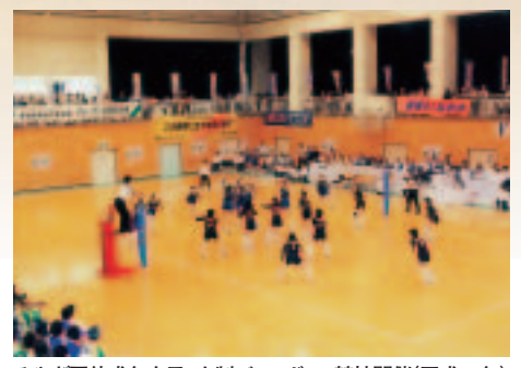
みやぎ国体成年女子9人制バレーボール競技開催 (平成13年)