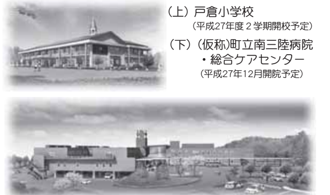
(上) 戸倉小学校 (平成27年度2学期開校予定) (下) (仮称)町立南三陸病院・総合ケアセンター (平成27年12月開院予定)