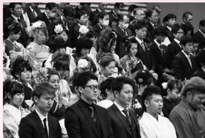
東日本大震災犠牲者に黙とう