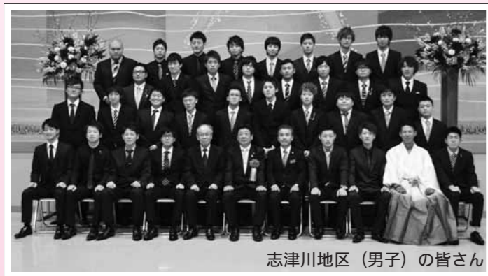
志津川地区（男子）の皆さん