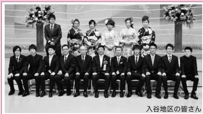
入谷地区の皆さん