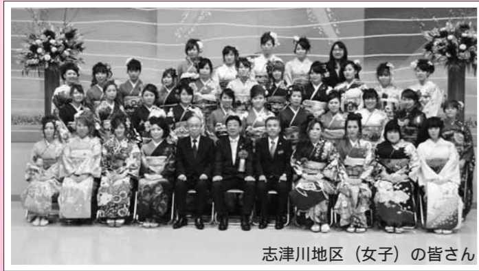
志津川地区（女子）の皆さん