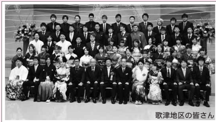
歌津地区の皆さん