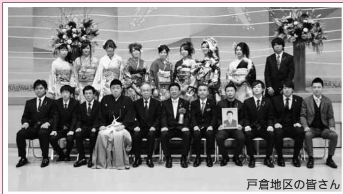
戸倉地区の皆さん