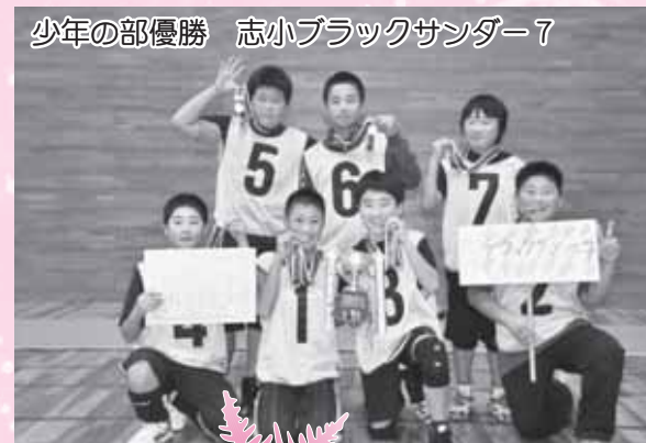
少年の部優勝 志小ブラックサンダー7

今後は地域の交流拠点として各種行事を実施しながら、子どもからお年寄りまで幅広い利用が見込める等、これまで以上にコミュニティの推進が期待されます。おめでとうございます。