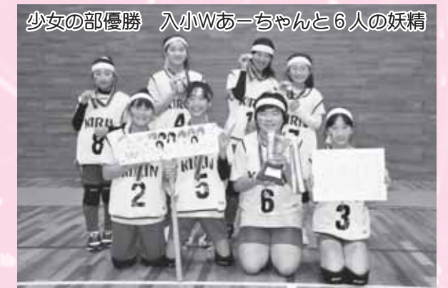
少女の部優勝 入小Wあーちゃんと6人の妖精