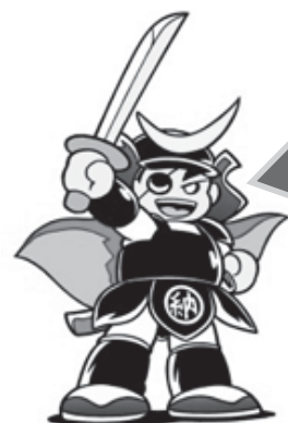
<納税キャラクター> おさむね君

町の申告相談会場では、申告書類確認票をもとに書類のチェックを行いますので、きちんと持ち物を確認してから申告会場へ向かいましょう。