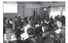
(おらほの申告教室)