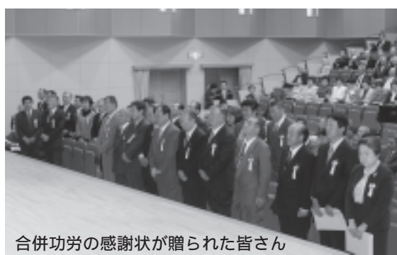
合併功労の感謝状が贈られた皆さん

発展への決意を出席者とともに確認しました。 式典では、合併に尽くされた旧歌津町長、旧町議会議長に総務大臣から表彰状が贈られ、志津川町・歌津町合併協議会委員に町長から感謝状が贈られました。