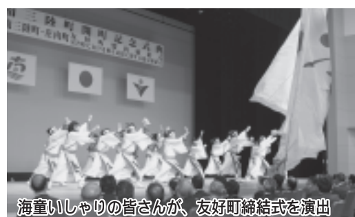
海童いしゃりの皆さんが、友好町締結式を演出