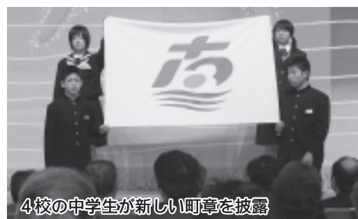
4校の中学生が新しい町章を披露