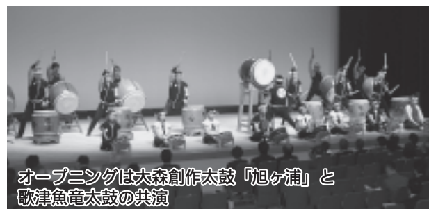
オープニングは大森創作太鼓「旭ヶ浦」と歌津魚竜太鼓の共演