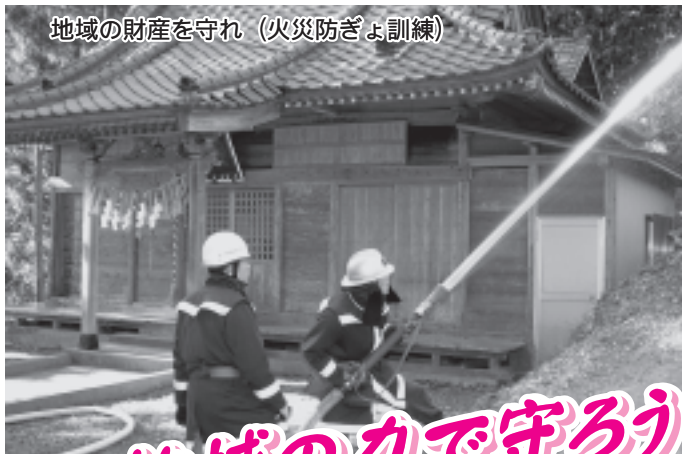
地域の財産を守れ (火災防ぎょ訓練)

生徒たちは船に乗り養殖漁場へ行き、わかめを刈り取った後、陸揚げされたわかめとめかぶを切り分け、ポイル作業などを見学したり、磯の香りを胸いっぱい吸い込みながら、一生懸命作業に取り組みました。