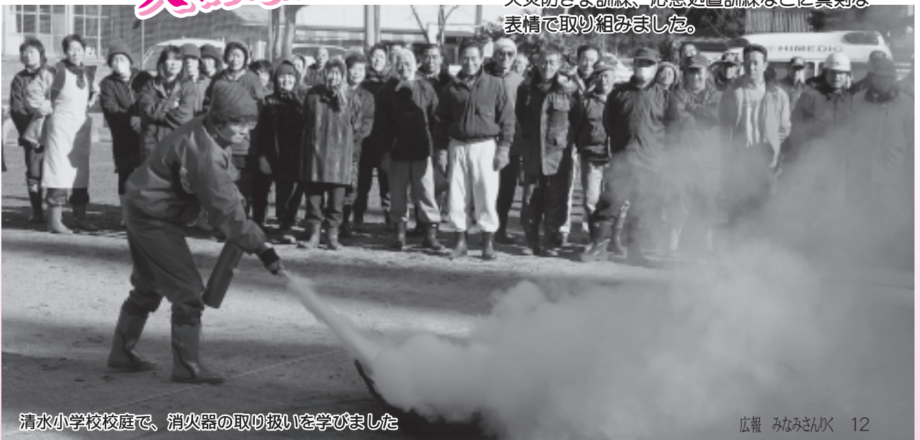
清水小学校校庭で、消火器の取り扱いを学びました

消防署、地域の消防団や婦人防火クラブなどの皆さん約160人が参加し、初期消火訓練、火災防ぎょ訓練、応急処置訓練などに真剣な表情で取り組みました。