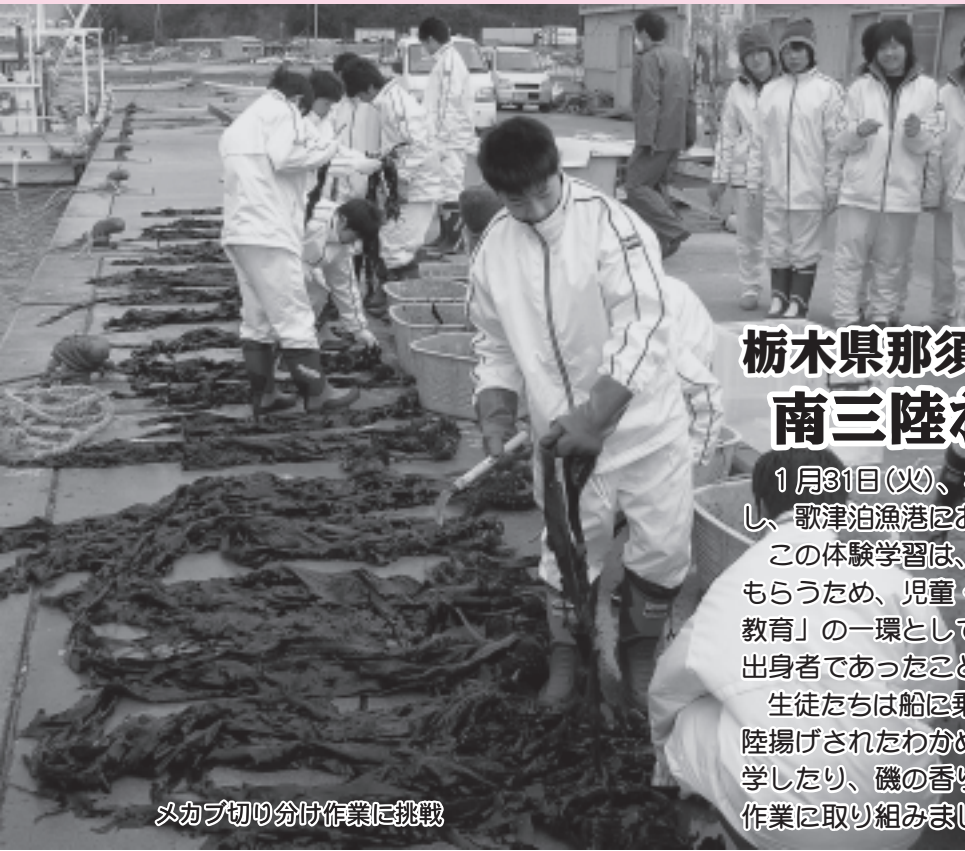
メカブ切り分け作業に挑戦