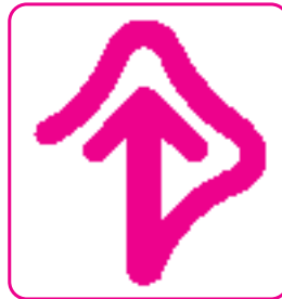
▲目のシンボルマーク

このマークのある窓口では、聴覚障害のある方、耳が聞こえにくい方のために、筆記のお手伝いをします。お気軽にご相談ください。