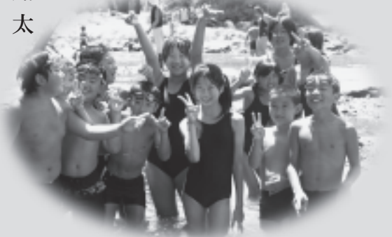
楽しかった川遊び

ぼくは、小学校最後の夏休みに思い出をいっぱい作ってきたので山形への国内交流に参加しました。 一番楽しみにしていた事は川遊びでした。5年生の時花山の合宿で楽しみにしていた沢登りが雨で中止になり悲しい思いをしたので、今回も天気がすこく気になりました。その日の天気は最高でぼくは朝からとても楽しみにしていました。 とても暑かったので川の水は冷たくて気持ちがよくずつと入っていたかったです。初めて食べたイワナの味はとておいしくて忘れられません。他の学校の友達もできました。山形の谷沢小学校と清川