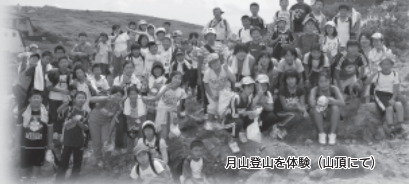
月山登山を体験(山頂にて)