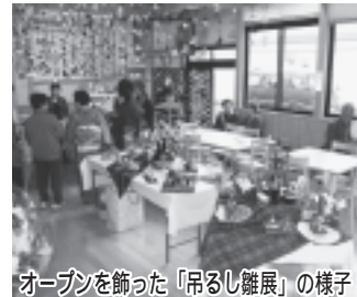
オープンを飾った「吊るし雛展」の様子 問い合わせ 企画課まちづくり推進係 ☎46-1371

た「ふるさと納税寄附金」を財源として活用し、整備したものです。 どなたでも気軽に利用できる施設ですので、交流や憩いの場としてぜひご利用ください。 ◇施設区分 1階 休憩室 2階 多目的室 どなたでも気軽に利用できる「休憩スペース」