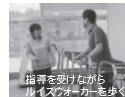
指導を受けながら ルイスウォーカーを歩く