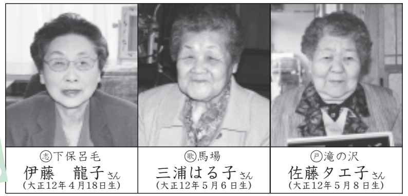
※このコーナーでは、町から敬老祝いが贈られた方々を紹介いたします。 (南三陸町敬老祝い金条例に基づき、満87歳(数え88歳)の誕生日を迎えた方々が対象です。)