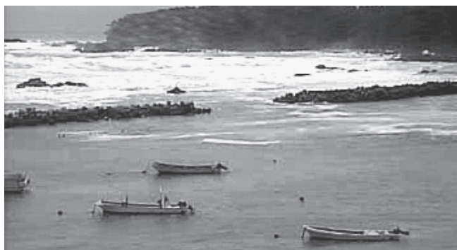
▶ばな漁港の様子（ライブカメラ）

防災情報提供システムでは、公共端末やインターネットが利用できる家庭用パソコンなどから、防災カメラのライブ映像を見ることができ、町内沿岸部の状況が随時確認できます。また、町ホームページに「避難所マップ」や過去の災害情報などを掲載し、防災に関する情報の提供を行っています。