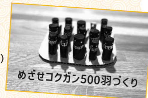
めざせコクガン500羽づくり

各プログラムの日時や持ち物などの詳しい内容は、申込専用サイトに掲載します。また、掲載されていないイベントの開催が急ぎよ決まる場合があります。その場合はビジターセンターのホームページやFacebook、申込専用サイトで募集をさせていただくことがあります。ご了承ください。