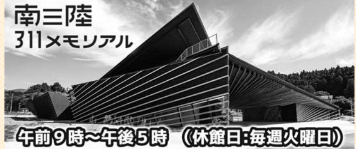
☎ 一般社団法人南三陸町観光協会 ☎28-9215 (47-2550)

これまでも、これからも、津波はやってきます。南三陸町での津波の歴史を紐解きながら、南三陸町の自然災害への備えをご紹介します。