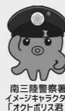
南三陸警察署 イメージキャラクター 「オクトポリス君」