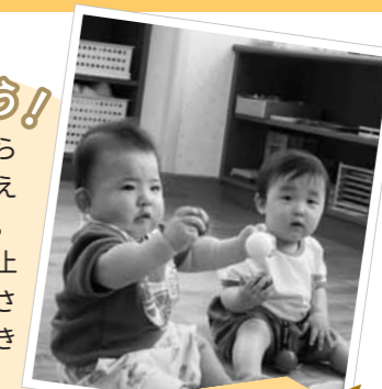
赤ちゃんは涼しい室内でゆったりと

水遊びをする際の持ち物をふくタオル、着替え、帽子（お家の人も）、濡れたものを入れる袋、飲み物