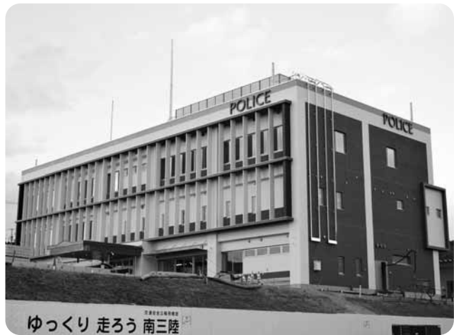
ゆっくり 走ろう 南三陸