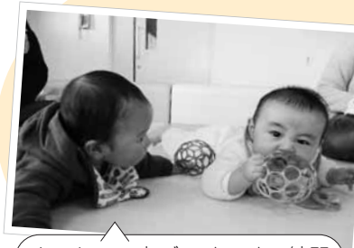
サークルの中でハイハイの練習（かわいい～）