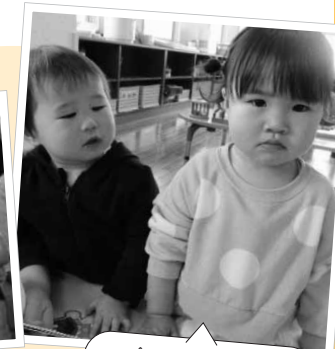
今はこんなに大きくなりました

ほんとうに大変な一年でしたが、町内のたくさんのお家の人に利用して頂き、Happyな一年を過ごせました!!