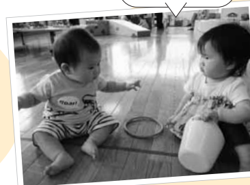
利用当初のかわいい2人

今年度は新型コロナウイルス流行のため、利用者みなさんには利用時間の変更や行事の取りやめなど、たくさんのご迷惑をおかけしました。そのたびにご協力を頂き、ありがとうございました。