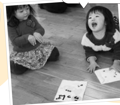
カルタとり・福笑いはみんな大好き！みんな上手になりました