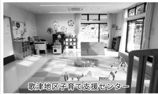
歌津地区子育て支援センター