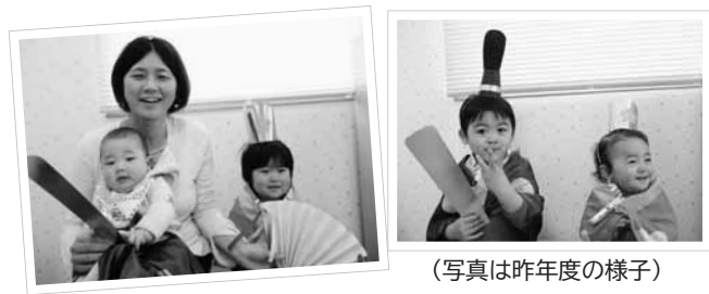
(写真は昨年度の様子)

3月3日(火)午前10時30分から、ひな祭り誕生会を行います。昨年度はお内裏様とお雛様の衣装を着て、記念写真を撮りました。今年は、3月生まれの誕生会と合同になりますので、ぜひお越しください!