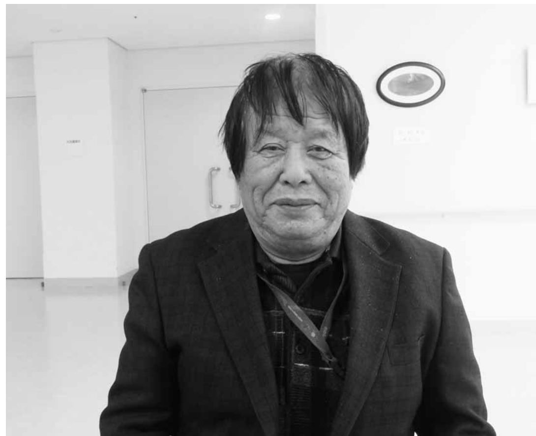
60歳を過ぎた年金手続の際に、戸籍上は衛(旧字体)と登録されていたと知った。母親からは「社会に役立つ人間になって欲しいとの思いから、衛(新字体)を使っていた」と明かされたと言う。