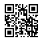
やまがた庄内 観光サイト