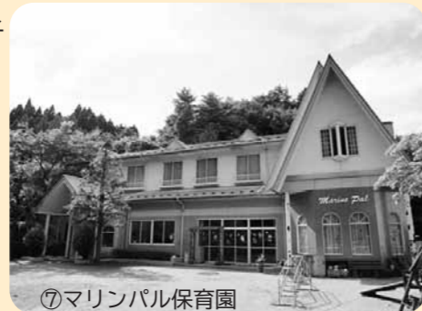
⑦マリンパル保育園