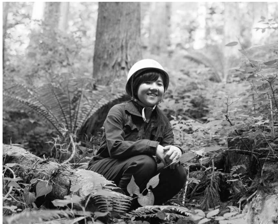
今年の6月には南三陸町内で林業経営を行う株式会社佐久に転職。「木材生産以外の木材の利用を企画していきたい」と意気込んでいる。