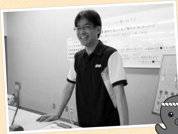
☎ 保健福祉課健康増進係 ☎46-5113

学生の際は陸上短距離のランナーだったので、今でも外で走ったりしています。アリーナに来て一緒にジョギングしませんか？