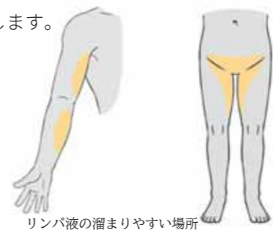
リンパ液の溜まりやすい場所