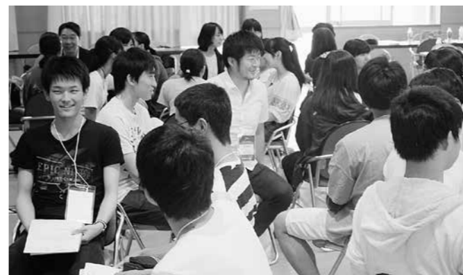
昨年度採択事業： U-18東北次世代リーダーカンファレンス2017 ～南三陸町の地域資源を活かした高校生の人材育成事業～