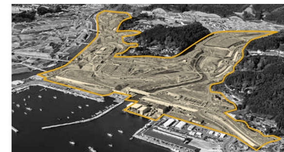
分譲・賃貸・交換区域