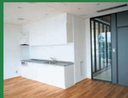
セミナー室 システムキッチンを完備しているので色々な用途で使えます