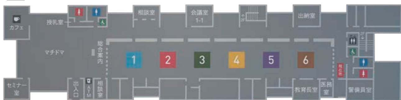
1 町民税務課 2 商工観光課 3 農業委員会 農林水産課 4 管財課 5 環境対策課 6 教育総務課 生涯学習課