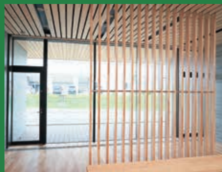
待ち合いスペース