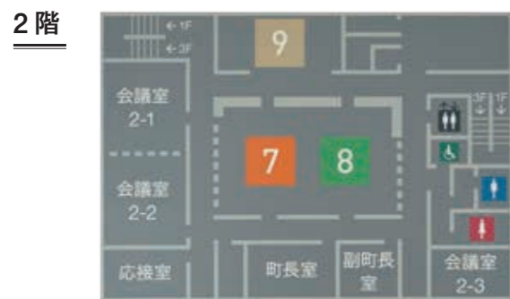
7 企画課 8 総務課 9 危機管理課