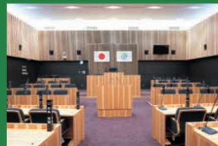
南三陸杉をふんだんに使った議場