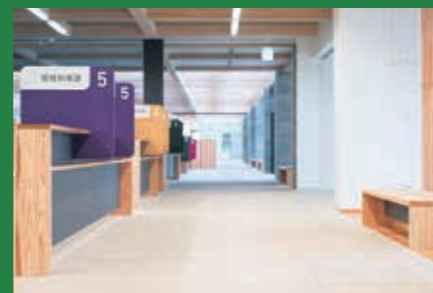
1階フロア 各部署が分かりやすい日本の伝統色を用いて標示