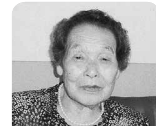
戸 藤浜 後藤 くまよさん 昭和5年6月26日