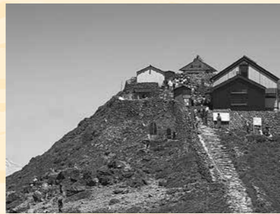
山頂にたたずむ月山神社