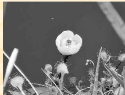
オゼコウホネ(7月中下旬見頃)