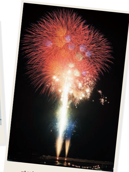
夜空に浮かぶ大輪の花