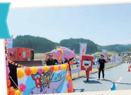
沖縄とのご縁を感じます