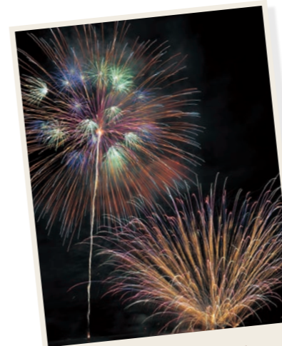
夏はやっぱりこれだね