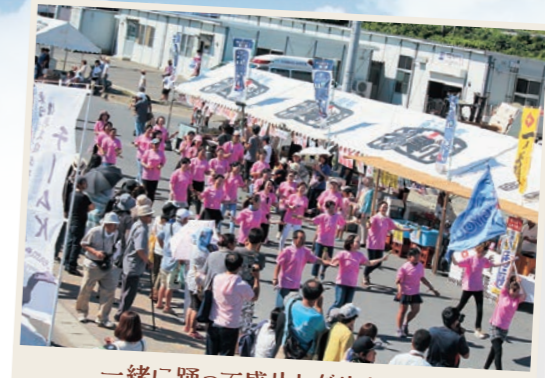
一緒に踊って盛り上がりましょう