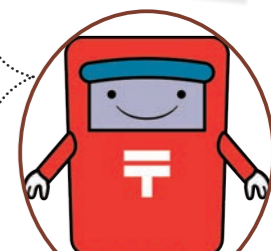
歌津復興夏まつり実行委員会?! ポストくん

【日時】8月6日(日)午前10時～午後8時30分 【会場】南三陸ハマレ歌津特設会場