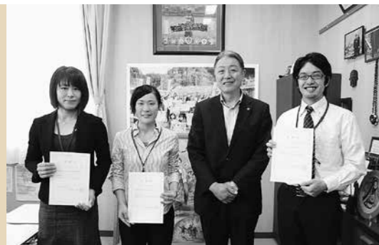
地域おこし協力隊事業 5,389万円