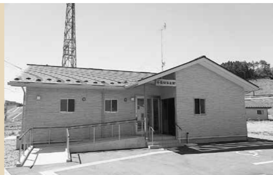
被災地域交流拠点 施設整備事業補助金 5,150万円