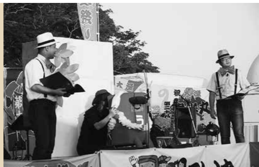
おらほのまちづくり支援事業補助金 1,000万円