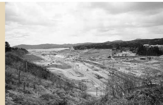
都市再生区画整理事業 27億8,272万円