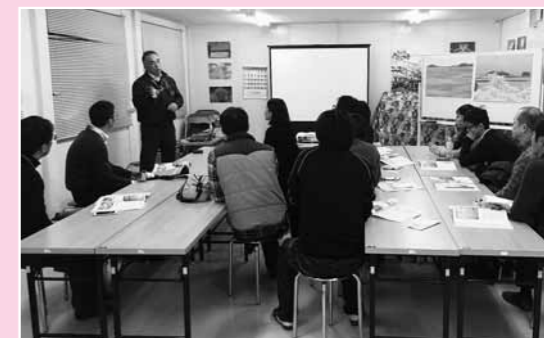
▲県漁協志津川支所戸倉出張所でカキ養殖のASC認証を取得した取り組みを勉強。