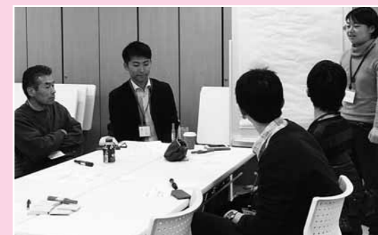
▲いりやどで研修や交流会を実施。先輩移住者の方にも多くご参加いただきました。