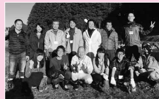
▲農工房ではトウキの収穫・水洗いを体験。 ※トウキ…セリ科の多年草で主に漢方薬として用いられる。

12月3日(土)・4日(日)に町内で移住体験ツアーを開催し、首都圏(東京都・埼玉県・神奈川県)から8名の方にご参加いただきました。実施後に回収したアンケートでの満足度は100%と、皆さんに南三陸町の魅力を感じていただくことができました。更に、4名の方が「1年以内の移住」を検討されており、継続的な支援を行なっていきます。